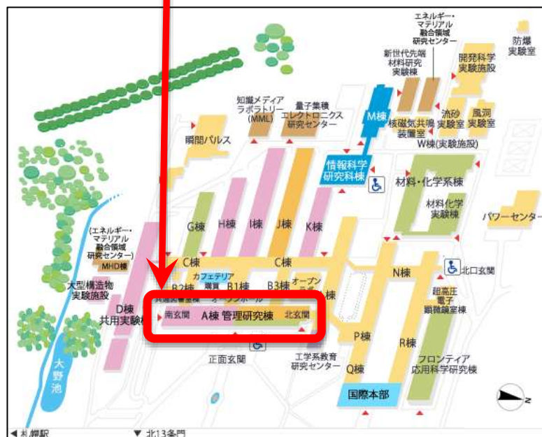
発表会場「工学部A棟」の立地図（北大工学部図）