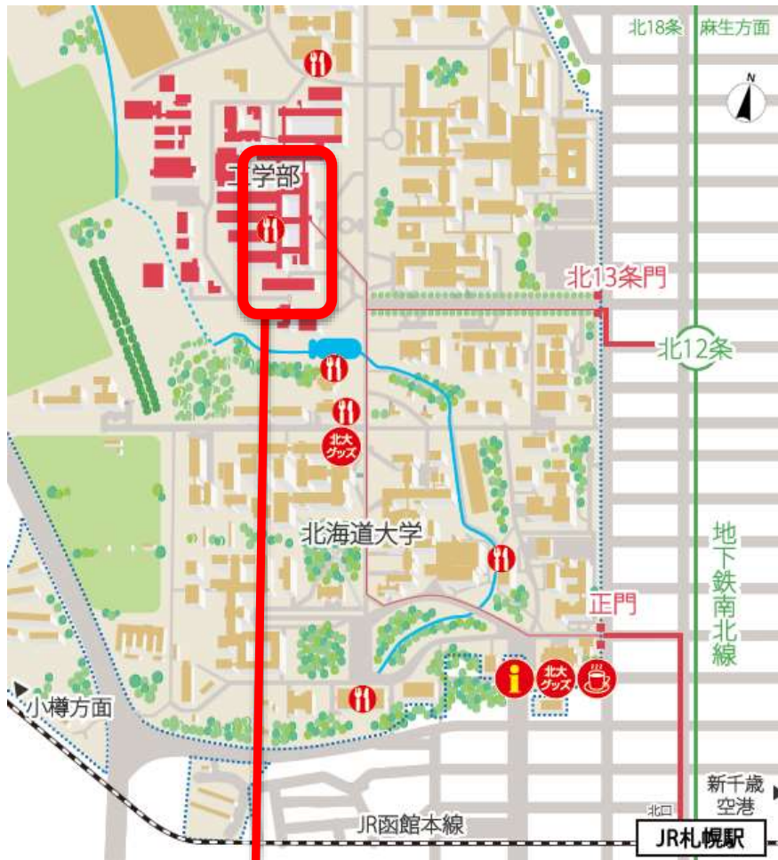
発表会場「工学部A棟」の立地図（北大広域図）